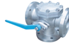
T型三通球阀4种启闭位置